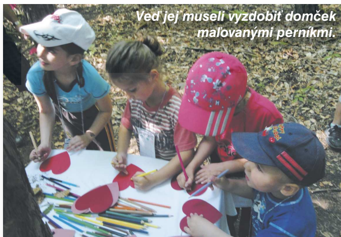
Ved' jej museli vyzdobiť domček maľovanými perníkmi.

Je sympatické, že pri príprave, organizácii a v priebehu celého Dňa sa zišli všetky generácie Malachovčanov. Veríme, že to bolo prínosom nielen pre deti, ale aj pre nás ostatných, a že sa budeme pri podobných príležitostiach stretávať aj naďalej. Držíme palce našim