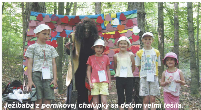
Ježibaba z perníkovej chalúčky sa deťom veľmi tešila.