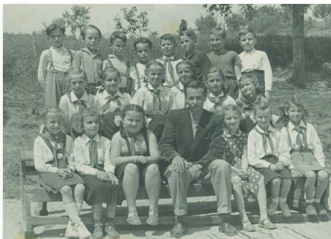
3. ročník Národnej školy v Malachove, šk. rok 1955-56.

pána učiteľa s dušou športovca aj herca, ktorý v Malachove rozprúdil čulý športový a kultúrny život nielen medzi mládežou, ale aj dospelými. Čítajte na str. 6-7.