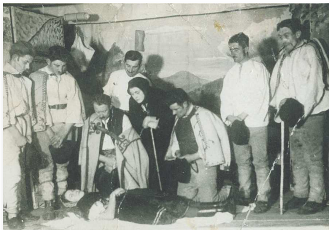
Bačova žena, režisér V. Lustig

Dnes je situácia trochu iná. Ťažšia, komplikovanejšia? Ťažko povedať. Zostalo nás naozaj len pár a len veľmi ťažko získavame nových členov. No možno sa nám blýska na lepšie časy, lebo máme prísľub na spoluprácu od niekoľkých mladých ľudí z obce – tak si tuho držíme palce. Dnes, keď je doba „nadvuková“, času je veľmi málo a priority sa presúvajú, sme naozaj radi, keď sa nám podarí nastudovať nejakú hru a zdarne ju aj odpremiérovať. Že to ešte robíme, je aj zásluha našich divákov, lebo nie je nič lepšie a opojnejšie ako pozitívne reakcie, smiech, potlesk, či vzájomná súhra medzi hercami a divákmi. A keď štrbinkou v opone vidíme, že sála je plná ... čo viac si môžeme priať. Sme vďační nášmu publiku, za vernosť a za všetko.