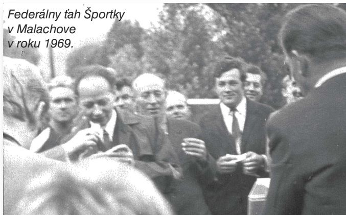
Federálny ťah Športky v Malachove v roku 1969.