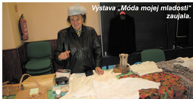
Výstava „Móda mojej mladosti“ zaujala.