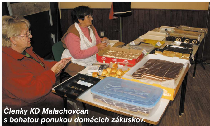
Členky KD Malachovčan s bohatou ponukou domácich zákuskov.