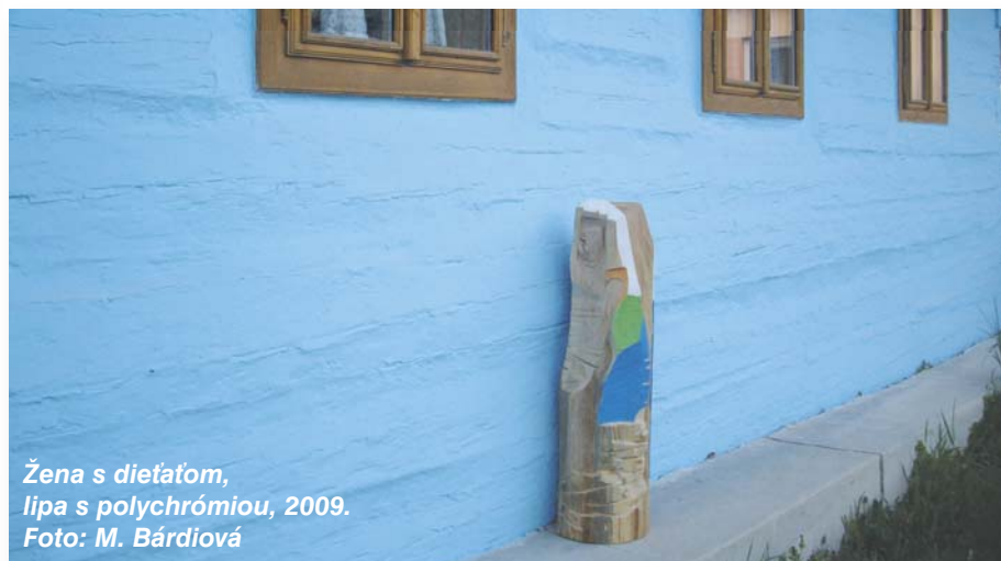
Žena s dieťaťom, lipa s polychrómiou, 2009.