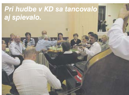
Pri hudbe v KD sa tancovalo aj spievalo.

Obec vyčlenila na túto akciu 500 eur, z ktorých sa zaplatili obe ľudovky, zástery a odznaky pre súťažiacich a plastový riad na servírovanie guláša. Hudobnú produkciu v sobotu zabezpečil M. Pál prostredníctvom B. Krnáča a podujatie moderovala