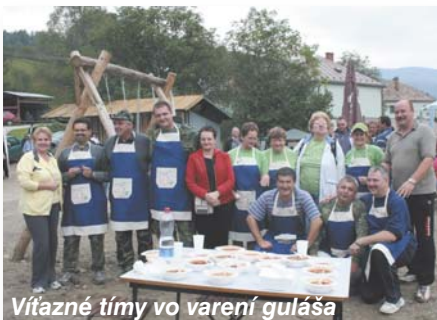
Vítané tímy vo varení guláša