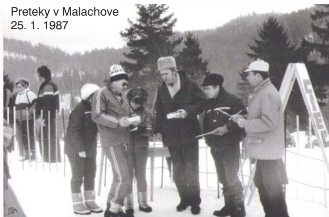
Preteky v Malachove 25. 1. 1987