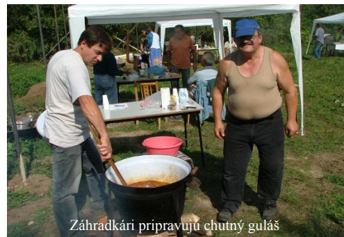
Záhradkári pripravujú chutný guláš

Na záver mi dovoľte popriať všetkým našim členom, ako aj ostatným spoluobčanom bohatú úrodu v záhradkách.