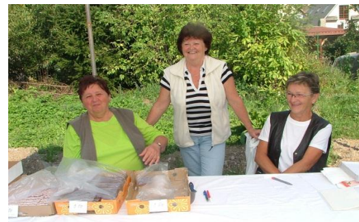
Dôchodkyne na Dňoch obce 2009