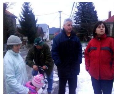
Prvé stretnutie občanov