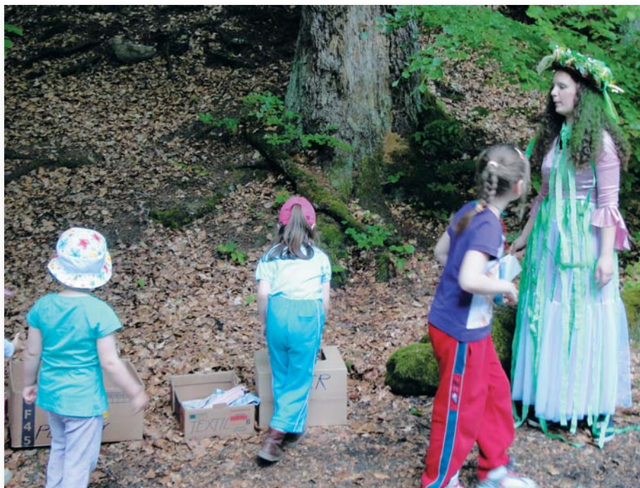
Víla učila separovať odpad.