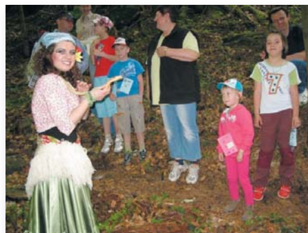
Cigánke museli deti zaspievať.

Finančne toto podujatie podporil Obecný úrad, organizačne zabezpečilo OZ MD. Veľká vďaka patrí ďalším sponzorom podujatia, za pomoci ktorých sme pre deti pripravili balíčky, či odmeny po absolvovaní súťaží.