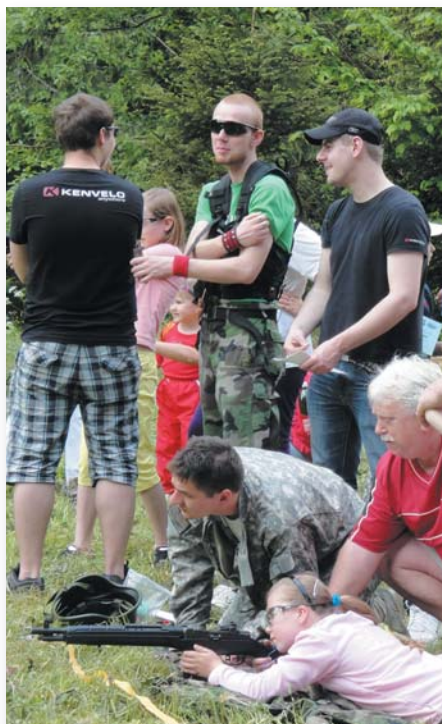
Zbrane lákali aj dievčatá.