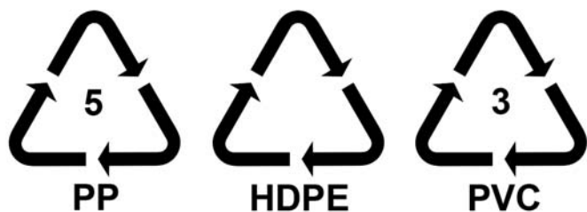
Obr. 1: Grafické označovanie plastových obalov.

Výrobcovia pre uľahčenie označujú obaly grafickými značkami (obr. 1), ktoré sú doplnené písomnými a číselnými údajmi. Označenie plastového obalu je viditeľné, stačí, ak si obal dôkladne prezriete. Výrobcovia uvádzajú označenia na nálepkách obalov, alebo je označenie vylisované (najčastejšie na dne obalu).