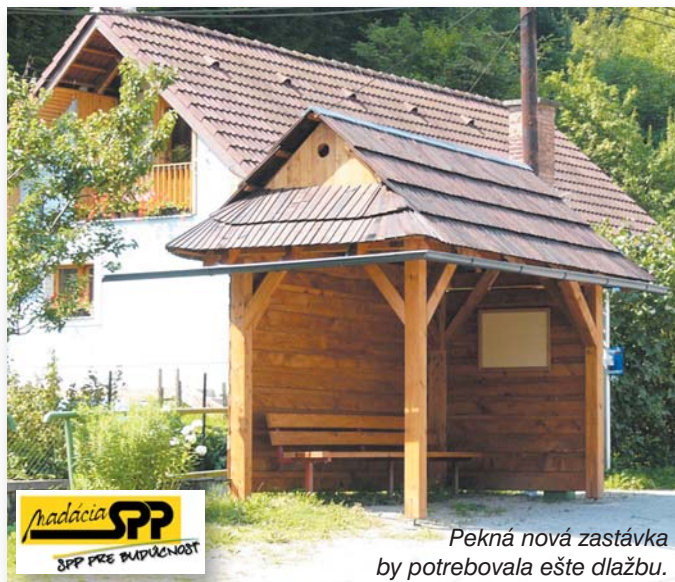
Pekná nová zastávka by potrebovala ešte dlažbu.

Podobne aj v TJ Slovan Malachov došlo k personálnym a organizačným zmenám. Dňa 4. augusta 2010 odhlasovalo Valné zhromaždenie delegátov TJ zloženie nového výboru aj revíziej komisie a ďalšie zmeny, ako napríklad začlenenie stolnotenisevého oddielu do TJ. Nové vedenie sľubuje oživenie športových aktivít v Malachove aj prostredníctvom zaktívovania turistického a lyžiarskeho oddielu. Viac o športe na 13. strane.