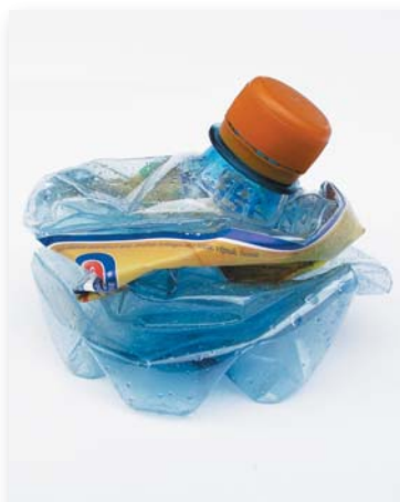
Zmenšený plastový obal.

Podľa vyjadrenia starostu obce patria do našich žltých vriec všetky plasty, o ktorých sme tu písali, pričom je dôležité, aby boli čisté. V deň zberu sa tento odpad odváža na zberný dvor, a do niekoľkých dní sa odváža na ďalšie spracovanie prostredníctvom Zberných surovín.