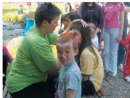
Maľovaním na tvár sa z detí stávali zvieratká a rozprávkové postavičky.

všetci tí, ktorí investovali svoj čas, energiu a dobrú náladu do zdarného priebehu