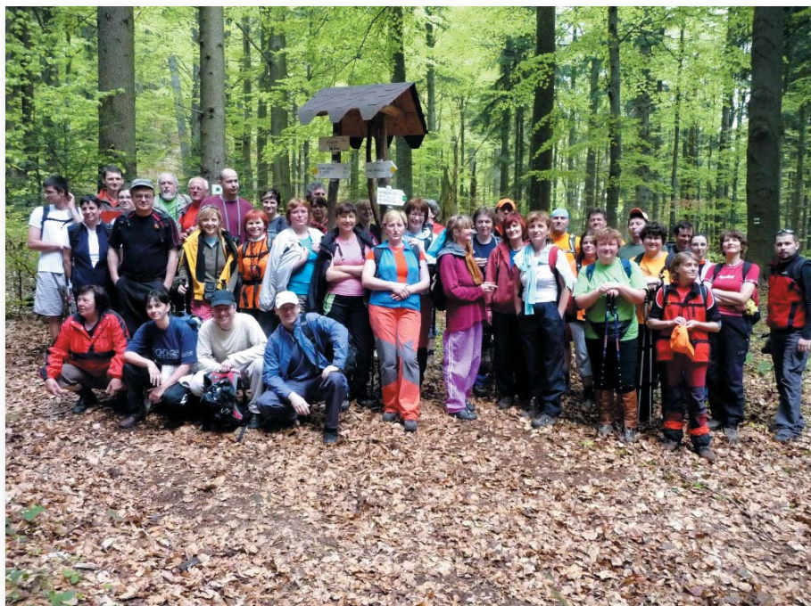
Účastníci pochodu na Košiaroch