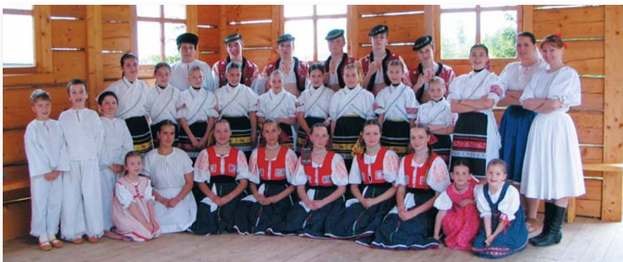
Helpa – súbor Malachovček na festivale Kolovrátkov v Helpe, foto: p. Rogožníková.

odtancovaného srdiečka, pretože bez nich by sme tu my boli úplne zbytoční.