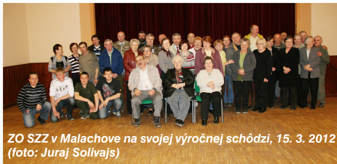
ZO SZZ v Malachove na svojej výročnej schôdzi, 15. 3. 2012

Dňa 7. 4. 2012 (na Bielu sobotu) organizujeme brigádu v Malých dolinkách na pohrabanie a ošetrovanie mladých stromčekov. Zároveň bude brigáda aj v záhrade ZŠ s MŠ , kde budeme ošetrovať ovocné stromy. Po brigáde podávame guláš a iné občerstvenie.