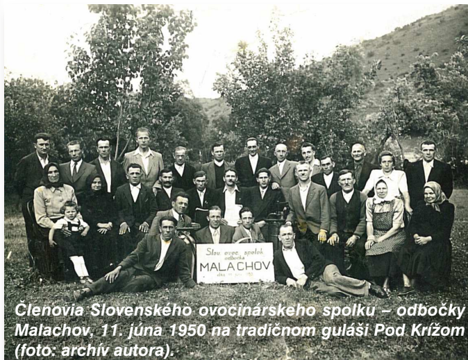
Členovia Slovenského ovocinárskeho spolku – odbočky Malachov, 11. júna 1950 na tradičnom guláši Pod Krížom.