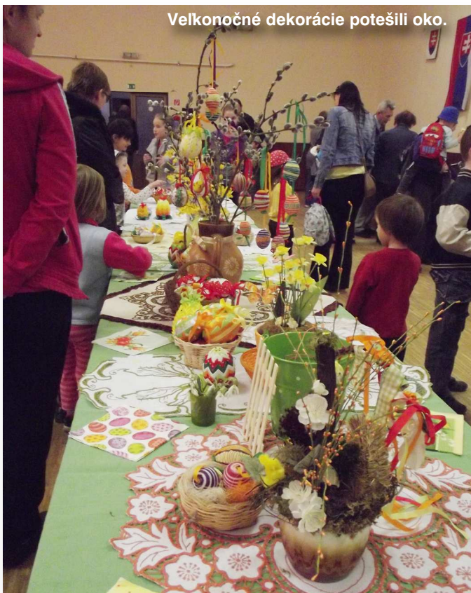
Veľkonočné dekorácie potešili oko.

Za výbor KD Malachovčan, E. Briedová, foto: autorka