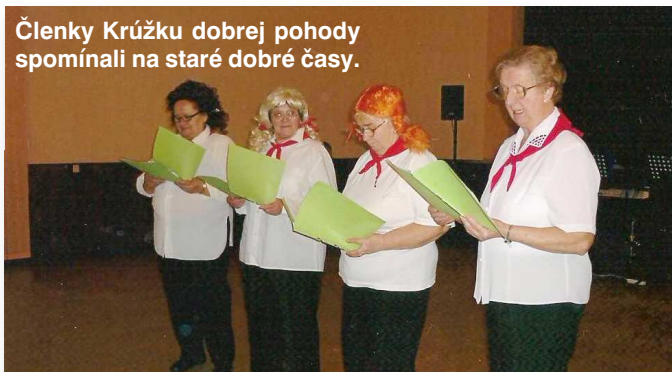
Členky Krúžku dobrej pohody spomínali na staré dobré časy.

do obecného múzea, miestnych zvykov a samozrejme aj samotnou prácou pri rekonštrukcii dreveničky. A čo za to? Jedinčná vec. Po realizácii domčeka sa stane pre nás aj miestom stretávania.