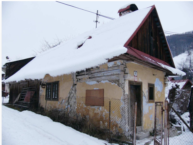
„Kováčovie dom“ v hornej časti Bučinovej ulice sa čoskoro zmení na obecné múzeum.