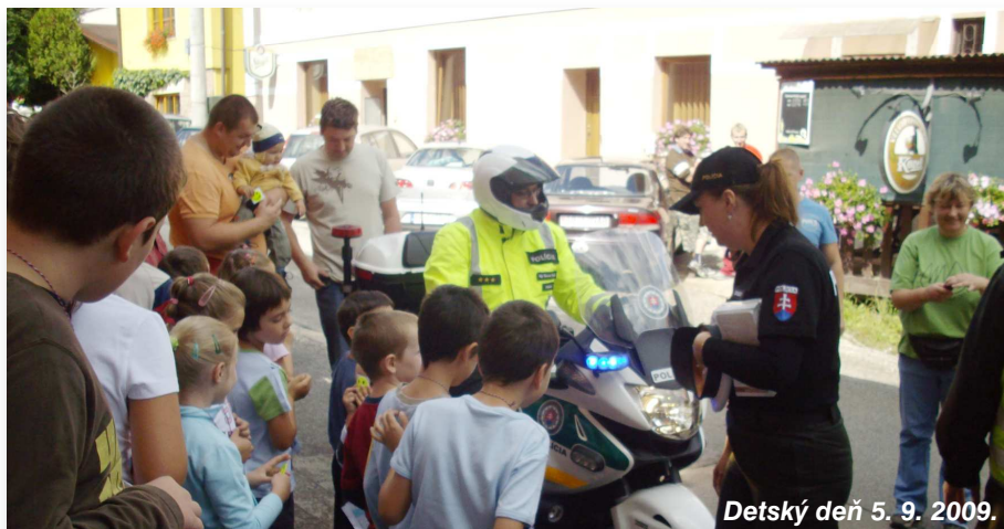
Detský deň 5. 9. 2009.