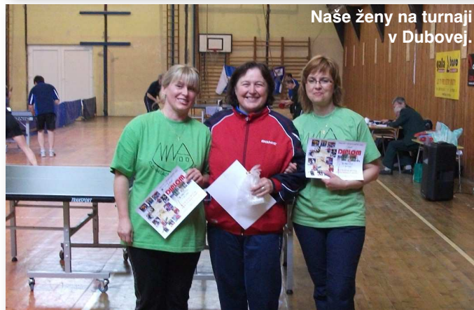
Naše ženy na turnaji v Dubovej.

Názov: Telovýchovná jednota SLOVAN Malachov Sídlo: Bučinová 5, 974 05 Malachov Právna forma: Občianske združenie IČO: 31914241