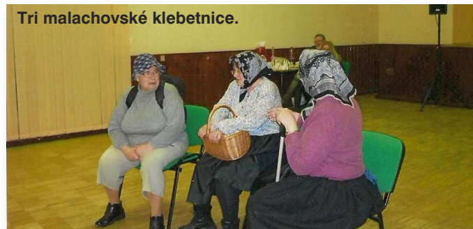
Tri malachovské klebetnice.

Naše dievčatá z krúžku „Dobrej pohody“ si pripravili scénu a pieseň s humorným zameraním. V prvej scénke prišli ako pionierky pozdraviť svojou piesňou „Dnes žiarivo nám slnko svieti“, oblečené v bielych blúzkach a s pionierskou šatkou na krku. V piesni zaspomínali na detstvo, ako aj na čas nežnej revolúcie, keď sa všetko zmenilo, na nízke dôchodky a prešli v predstavách aj do budúcnosti, kde nás čaká domov dôchodcov. V druhej mini scénke sa predstavili ako „Tri malachovské klebetnice“, v ktorej spomínali aj činnosť v klube, ako je tam dobre, ako sa radi zabávame a ako tam radi chodíme. Na záver zaspievali aj hymnu KD „Žijem, žijem, doma neseďavam, dôchodca som, na svet nenadávam ...“. Na dobrú náladu, do spevu a do tanca hral a spieval už osvedčený p. Kúš do neskorých nočných hodín.