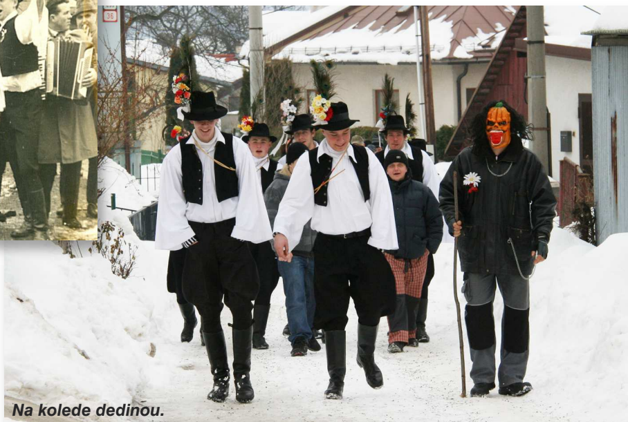
Na kolede dedinou.