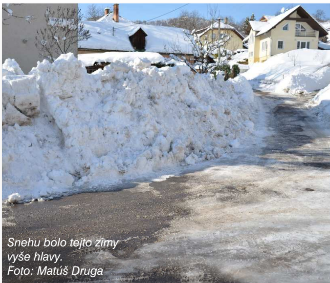
Snehu bolo tejto zimy vyššie hlavy.

Pozn. redakcie: Pokiaľ vieme, obyvatelia danej ulice pri potoku majú v zime naozaj problém s vysokou vodou, najmä keď potok zamrzne, preto sa im vysýpanie snehu do potoka nemuselo páčiť. Či sa celá situácia nedala riešiť inak je na zvážení každého zainteresovaného. Prípadnú reakciu dotknutých osôb radi uverejníme aj v letnom čísle.