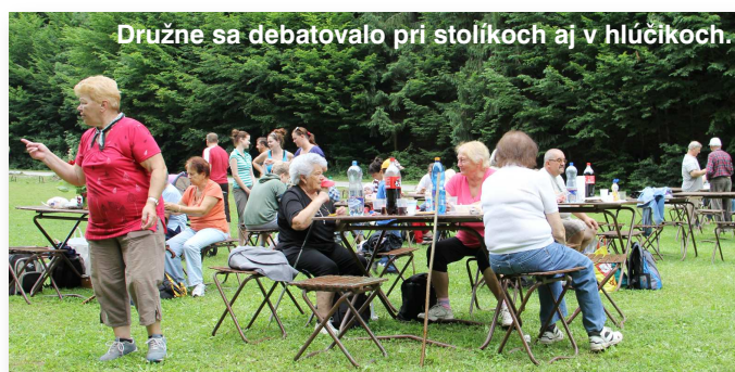
Družne sa debatovalo pri stolíkoch aj v hlúčikoch.

Pozn. redakcie: V príspevku ovocinárov sa uvádza názov nášho obnoveného oddychového miesta či rekreačnej lúky ako „Pod Krížom“, tak, ako toto miesto – presnejšie jeho hornú časť, poznajú Malachovčania od čias, keď ešte stál vyššie nad ním, nad dnešnou asfaltkou asi 50 m vyššie vodopádu pri ceste kríž, čo je asi 200 m od horného konca lúky – parkoviska. Bralo Skalka je asi 200 m nad východiskom náučných chodníkov a tabuľou o bralách Malachovskej doliny, a na názve Pod Skalkou sa dohodli ľudia v OZ Malachovská dolina, keď pripravovali projekt obnovy lúky ako rekreačného miesta. Dôležité je vedieť, že či ideme na lúku Pod Krížom, alebo Pod Skalkou, stretneme sa na tom istom peknom a upravenom mieste s potrebným vybavením. Vďaka všetkým, ktorí sa o to zaslúžili.