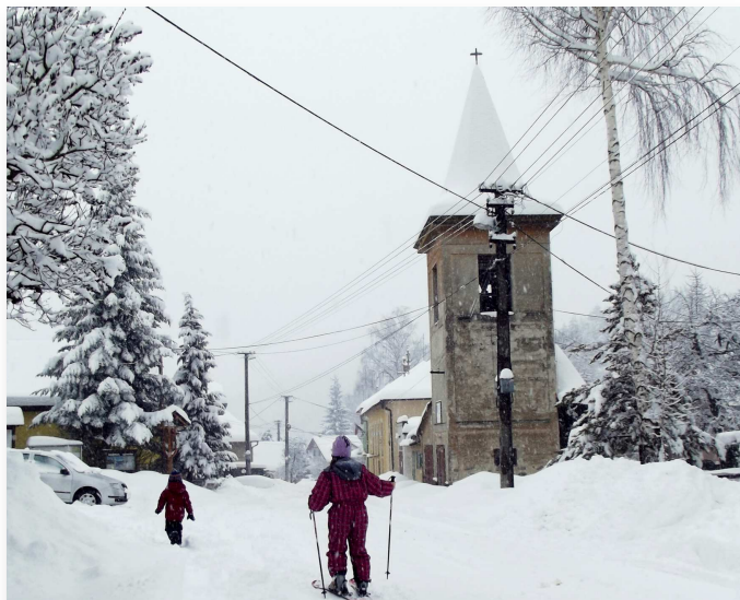
Lyžovačka v uliciach Malachova, Veľký piatok 2013 Vyjadrenie starostu obce k zimnej údržbe si prečítate na str. 10.