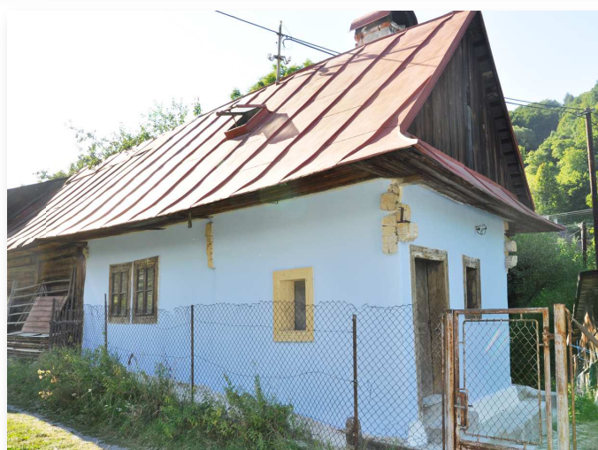
„Kováčvie domček“ už v novom, modrom šate, opravený a vybielený aj zvnútra. O postupe prác informuje Z. Drugová na str. 11.