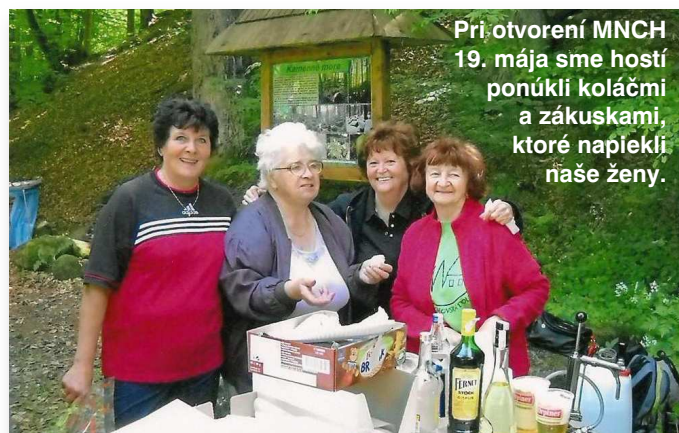
Pri otvorení MNCH 19. mája sme hostí ponúkli koláčmi a zákuskami, ktoré napiekli naše ženy.

Veľmi pekná akcia obce Malachov a OZ Malachovskej doliny bolo slávnostné otvorenie Malachovských náučných chodníkov – banskej cesty dňa 19. mája. Prispeli sme aj my, a to tým, že naše ženy upiekli domáce zákusky a koláče pre pozvaných hostí.