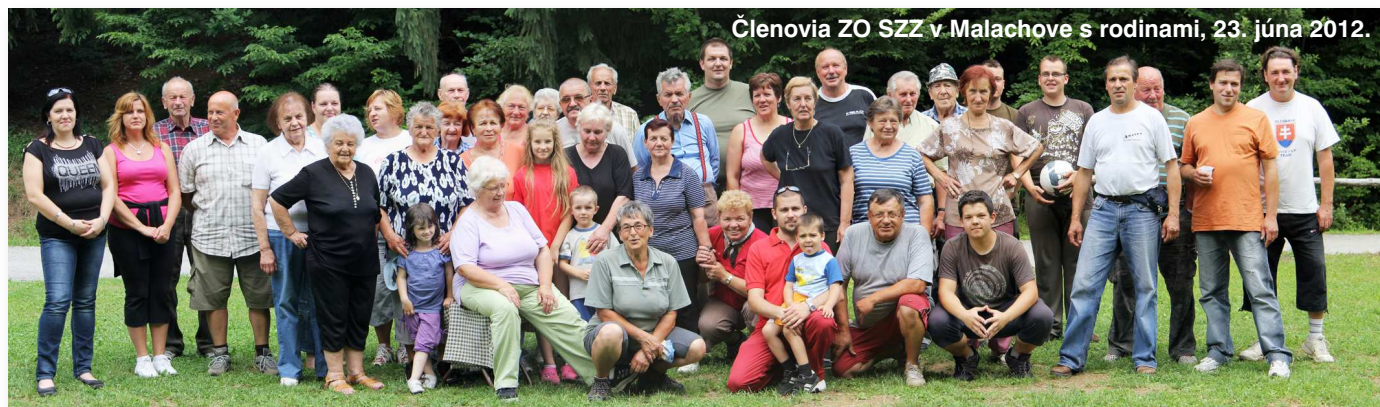
Členovia ZO SZZ v Malachove s rodinami, 23. júna 2012.

Pozn. redakcie: V príspevku ovocinárov sa uvádza názov nášho obnoveného oddychového miesta či rekreačnej lúky ako „Pod Krížom“, tak, ako toto miesto – presnejšie jeho hornú časť, poznajú Malachovčania od čias, keď ešte stál vyššie nad ním, nad dnešnou asfaltkou asi 50 m vyššie vodopádu pri ceste kríž, čo je asi 200 m od horného konca lúky – parkoviska. Bralo Skalka je asi 200 m nad východiskom náučných chodníkov a tabuľou o bralách Malachovskej doliny, a na názve Pod Skalkou sa dohodli ľudia v OZ Malachovská dolina, keď pripravovali projekt obnovy lúky ako rekreačného miesta. Dôležité je vedieť, že či ideme na lúku Pod Krížom, alebo Pod Skalkou, stretneme sa na tom istom peknom a upravenom mieste s potrebným vybavením. Vďaka všetkým, ktorí sa o to zaslúžili.