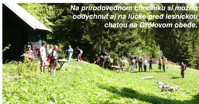
Na prírodovednom chodníku si možno oddýchnuť aj na lúčke pred lesníckou chatou na Grofovom obeđe.

Ďalšie dve pripravované prírodno-historické trasy: Historický chodník cez staroveké hradisko Hrádok a historická horská Poštová cesta z „medenej“ Bystrice do „zlatej“ Kremnice cez Tri kríže a Hostinec.