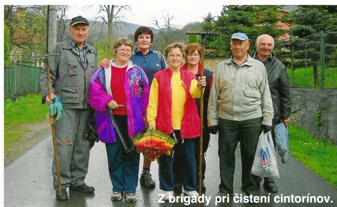
Z brigády pri čistení cintorínov.

Ako každý rok tak aj tento sme 24. apríla vyčistili obidva cintoríny . Zišlo sa nás 20 členov klubu. Po brigáde sme si v kultúrnom dome urobili malé občerstvenie.