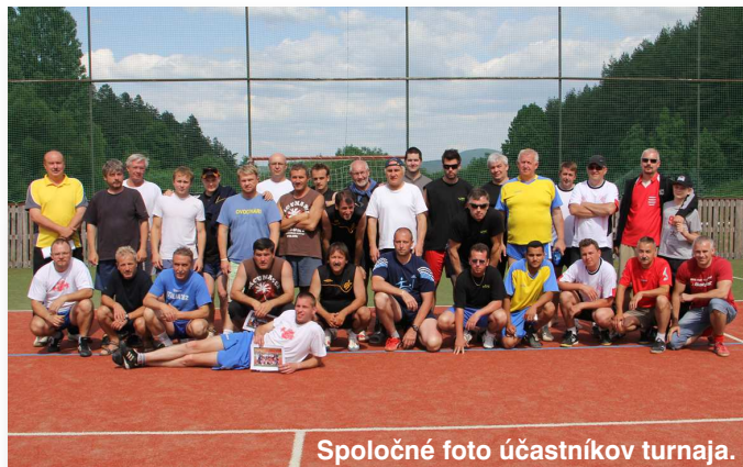
Spoločné foto účastníkov turnaja.