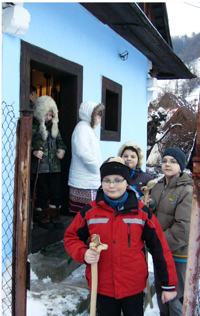
Deti odchádzali z novootvoreného múzea s novými zážitkami.